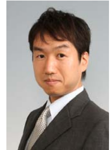
講師プロフィール

「あなたはあなた。私は私。」自分と相手の価値観が違って相手も矯正しようとしないうこと。相手も精一杯なのです。もしかするとあなたも精一杯なのかもね。